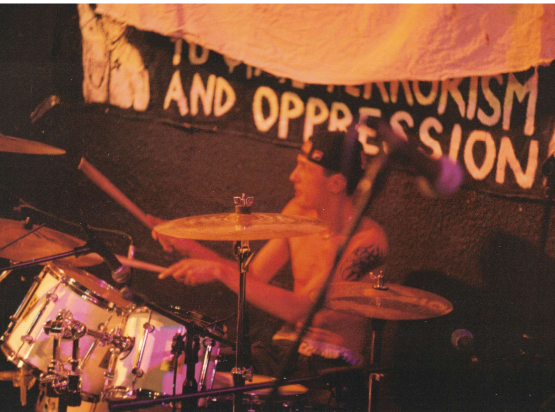
Koncert w Kole Podkowy