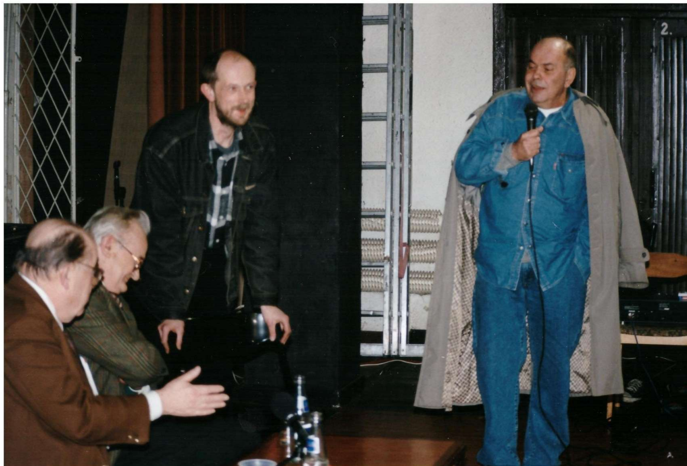
Jacek Kuroń z wizytą w Kole Podkowy (sala kinowa)