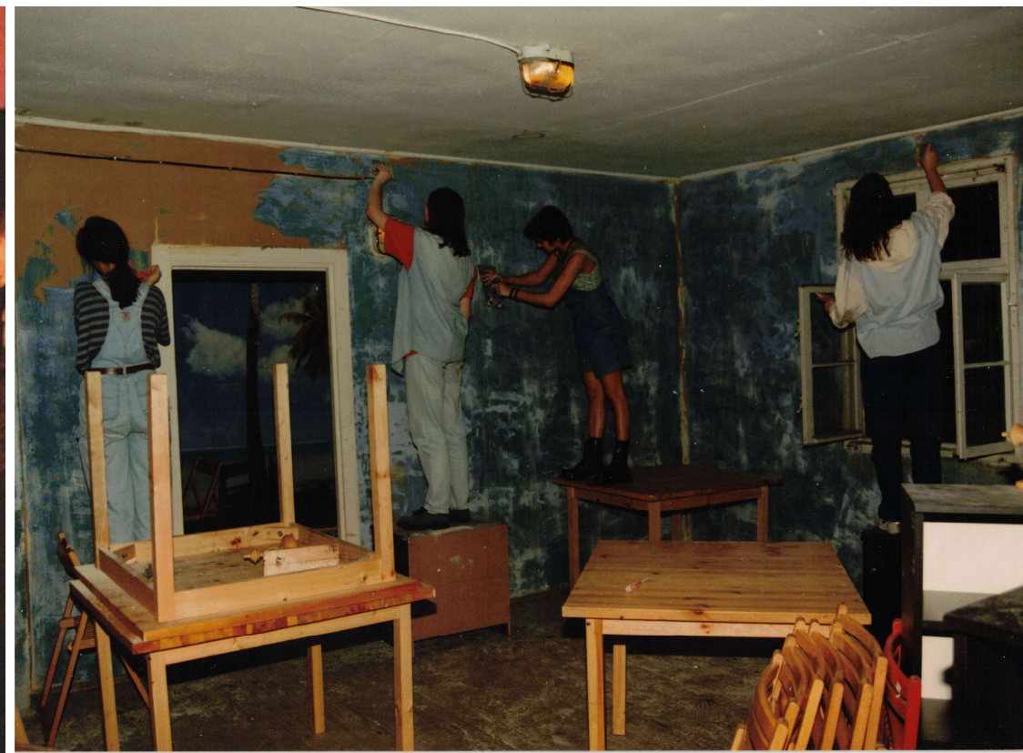
Remont dawnej „małej galerii”