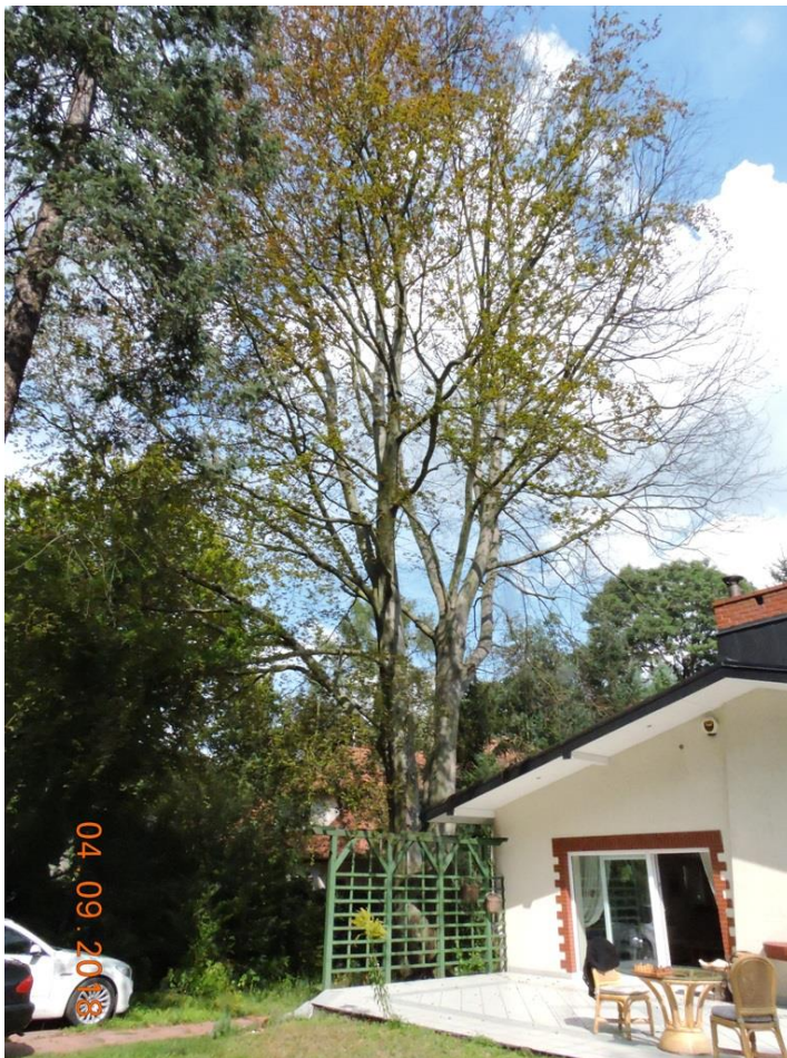
Ryc. 5 Buk pospolity odm. purpurowa, widok od strony południowo-zachodniej.

Buk jest wpisany do rejestru pomników przyrody pod numerem 1155 i rośnie na posesji prywatnej, przy ul. Bukowej 38 w Podkowie Leśnej. Drzewo rośnie przy