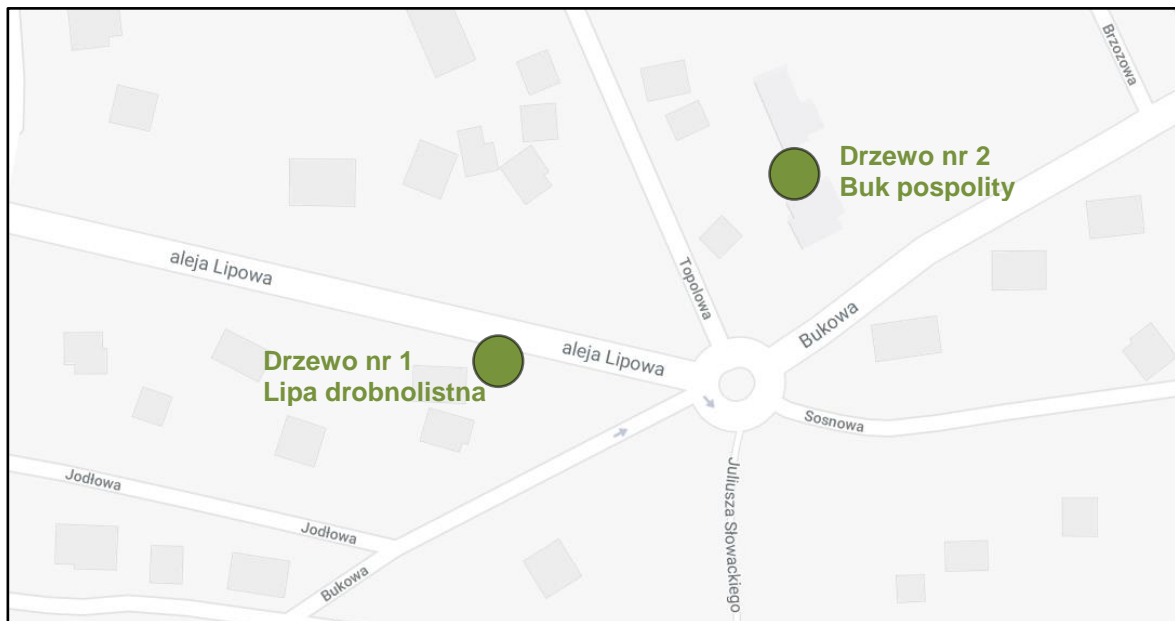
Ryc. 1. Lokalizacja drzew stanowiących przedmiot ekspertyzy w terenie

Przedmiot ekspertyzy stanowią 2 drzewa rosnące w Podkowie Leśnej wpisane do rejestru pomników przyrody: lipa drobnolistna ( Tilia cordata ) wchodząca w skład alei lipowej oraz buk pospolity odm. purpurowa ( Fagus sylvatica Purpurea ). Celem niniejszej ekspertyzy jest ocena stanu przedmiotowych drzew, pod kątem ich ewentualnego zagrożenia dla otoczenia.