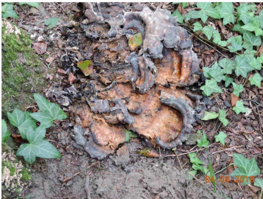
Ryc.6 – zaschnięte owocniki huby u podstawy pnia buka.

Wschodnia część korony w chwili oględzin była całkowicie martwa, natomiast część zachodnia wykazywała jeszcze żywotność. Ze stanu ulistnienia na części zachodniej korony wynika, że drzewo weszło już w stadium kladoptozy, czyli obumierania. Część liści w trakcie trwającego okresu wegetacji obumarła, pozostając na pędach. Pozostałe żywe liście posiadały stosunkowo niewielkie blaszki.