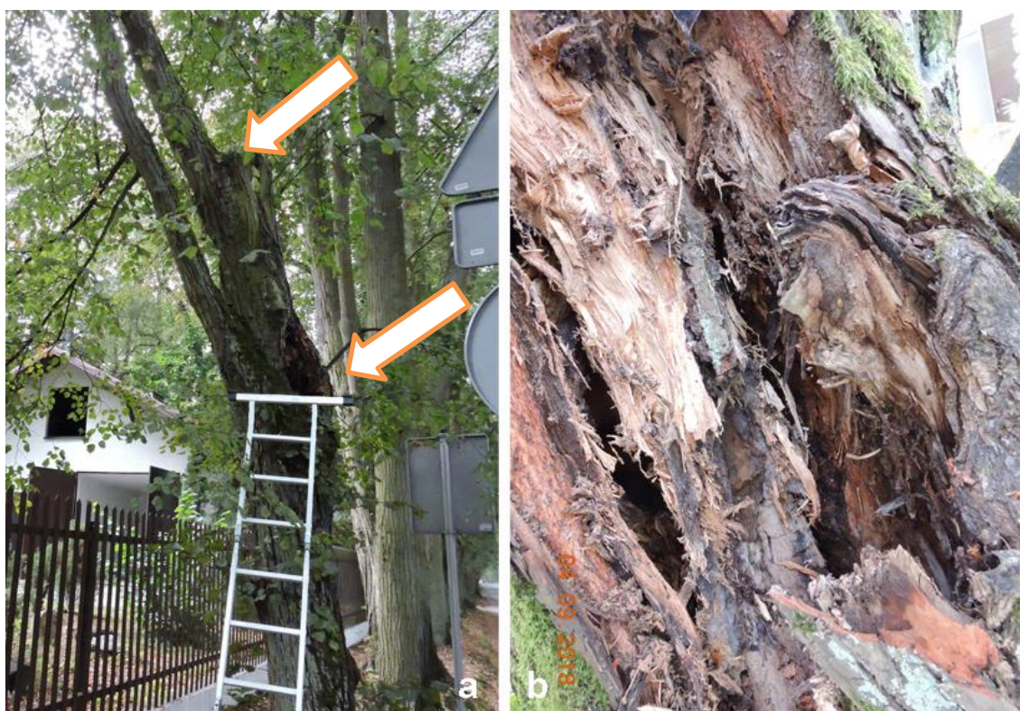
Ryc.3 – lipa rosnąca w zabytkowej alei.(a) strzałka dolna wskazuje miejsce zlokalizowania ubytku w pniu po wyłamaniu w przeszłości konarze. Górny kikut po drugim wyłamaniu konarze powyżej. (b) wypróchnienie w ubytku po zdjęciu wierzchniej warstwy korka.

Jak wynikało z oględzin, koronę w przeszłości tworzyły dwa konary konstrukcyjne, rozwidlające się na wysokości ca 2,8 m nad poziomem gruntu. W przeszłości konar od strony północnej z niewiadomych przyczyn uległ wyłamaniu. Powstała rana z czasem przekształciła się w ubytek wgłębny. W chwili oględzin, na powierzchni ubytku zalegała korowina, po zdjęciu której uwidoczniło się potężne wypróchnienie pnia wypełnione próchnem. Jak wykazało sądowanie ubytku, jego komora sięga na głębokość ca 90cm i w najszerszym miejscu, czyli na wysokości 260 cm nad poziomem gruntu miała średnicę 44 cm. Średnica pnia w tym miejscu wynosiła 53cm. Ściany komory miały grubość w tym miejscu od 4 – 5cm. W ubytku zalegało suche próchno (ryc. 3b).